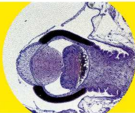
oeille du manteau de Pecten maximus oocel of Pecten maximus 's mantle