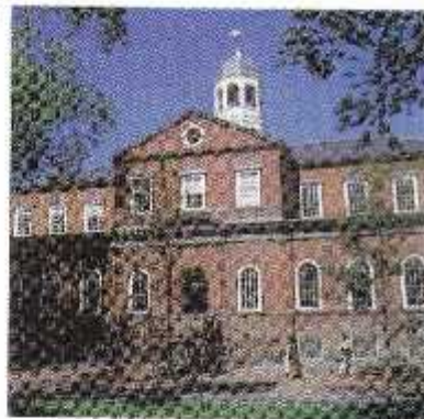
THE UNIVERSITY OF THE SOUTH ALABAMA